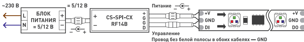
Рисунок 1. Подключение одной SPI-ленты с током потребления менее 2 А.

3.3. Убедитесь, что схема собрана правильно, везде соблюдена полярность подключения, и провода нигде не замыкаются.