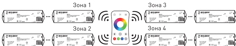
Рис. 3. Вариант построения системы с 4-зонным пультом дистанционного управления